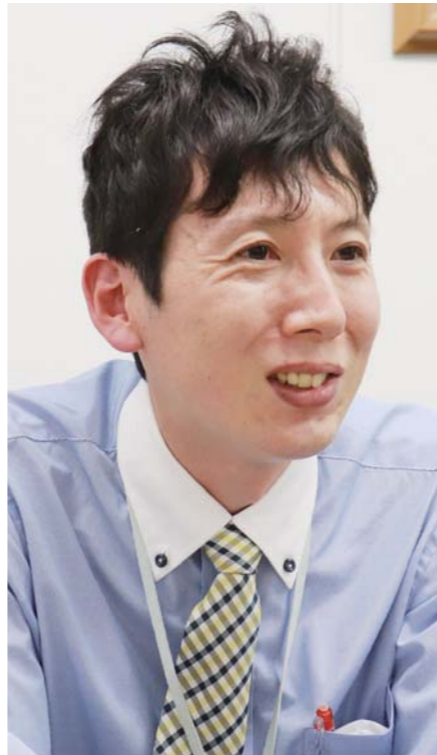
住友重機械エンバイロメント 水処理統括部技術部 水処理技術グループ