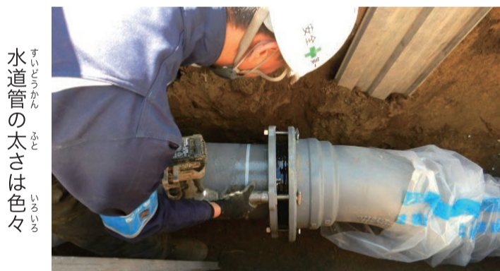
水道管の太さは色々