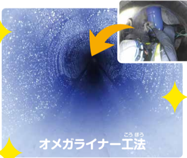
オメガライナー工法