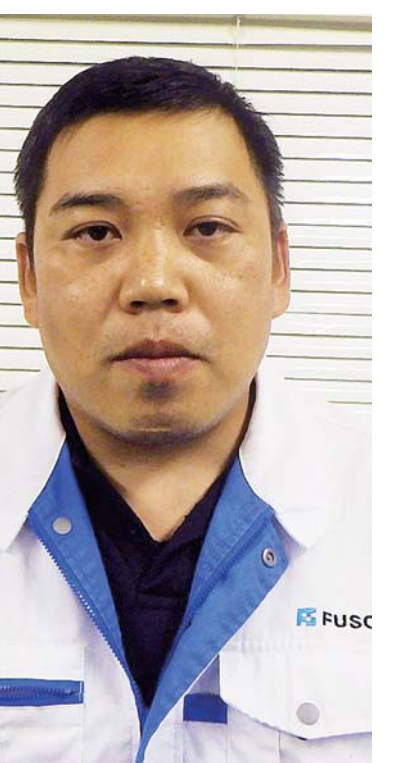
現場と地域つなぐ誇り

■現場の スベシャリストに 入社から1年半ほどは 一般土木の部署で働き ました。その後下水道の 手をかける今の部署へ 移りました。現場工程や 予算の管理、安全衛生対 策に関する指導のほか、 元請け企業との交渉・打 合せなど全般を行います。 最初は何となく不安な タートル、仕事を慣れた 頃から現場代理人として デビューします。更生工